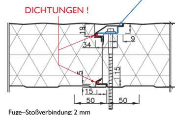
Fuge-Stoßverbindung: 2 mm

Druckverteilerplatte (Z29) zur Verbesserung der statischen Eigenschaften im System laut Zubehörliste lieferbar!